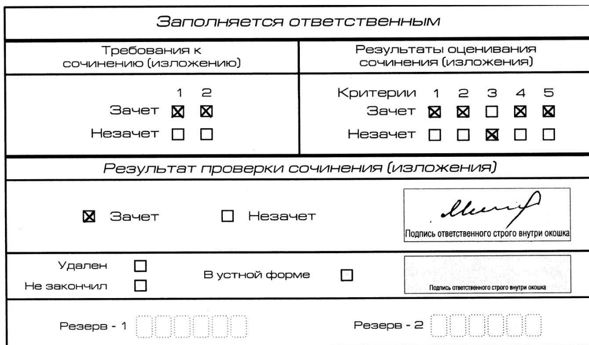
Рис. 10. Область для оценки работы

3. Во всех остальных случаях итоговое сочинение (изложение) проверяется по всем пяти критериям и оценивается по системе «зачет»/«незачет» (например, нельзя не проверять работу по критериям К4 и К5, если участник получил зачет на основании зачетов по критериям К1, К2, К3).