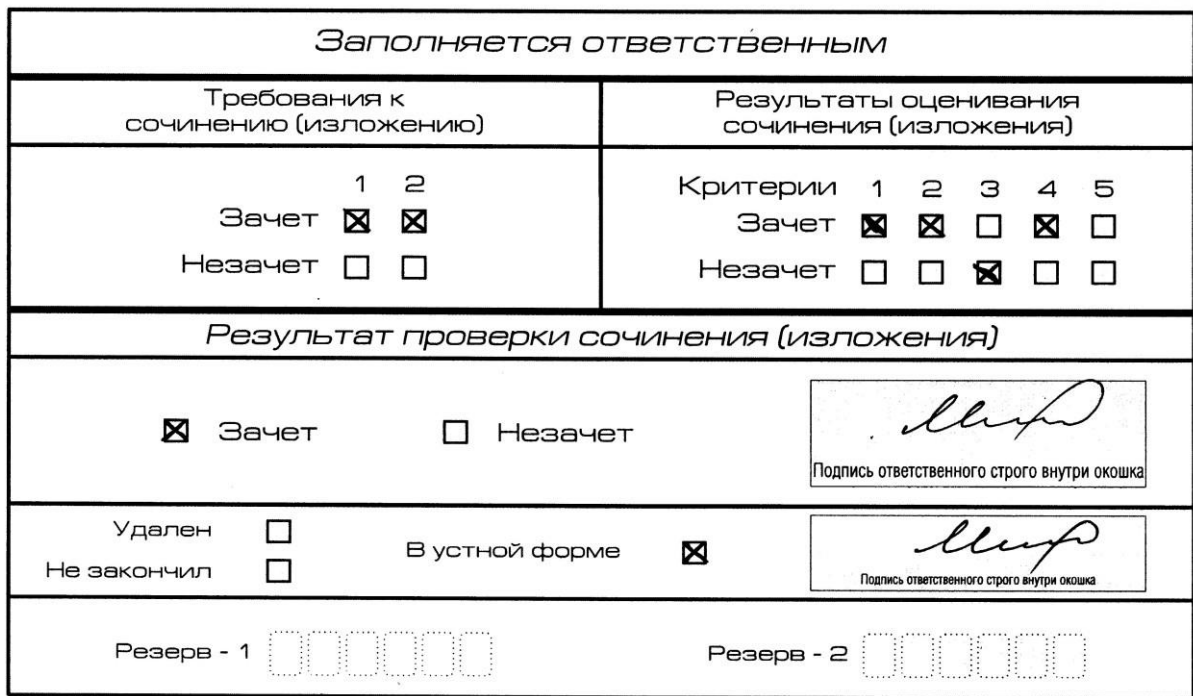
Рис. 11. Область для оценки работы сочинения (изложения) в устной форме

После окончания заполнения бланка регистрации ответственное лицо ставит свою подпись в специально отведенном для этого поле.