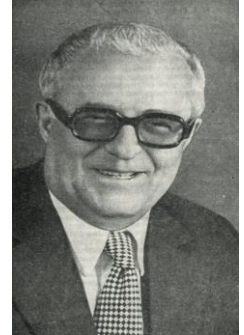
Александр Порфирьевич Бородин